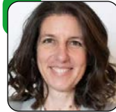
Eva Saldaña Directora ejecutiva de Greenpeace España