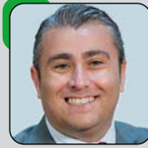
Sr. Virgilio Moreno Alcalde de Inca